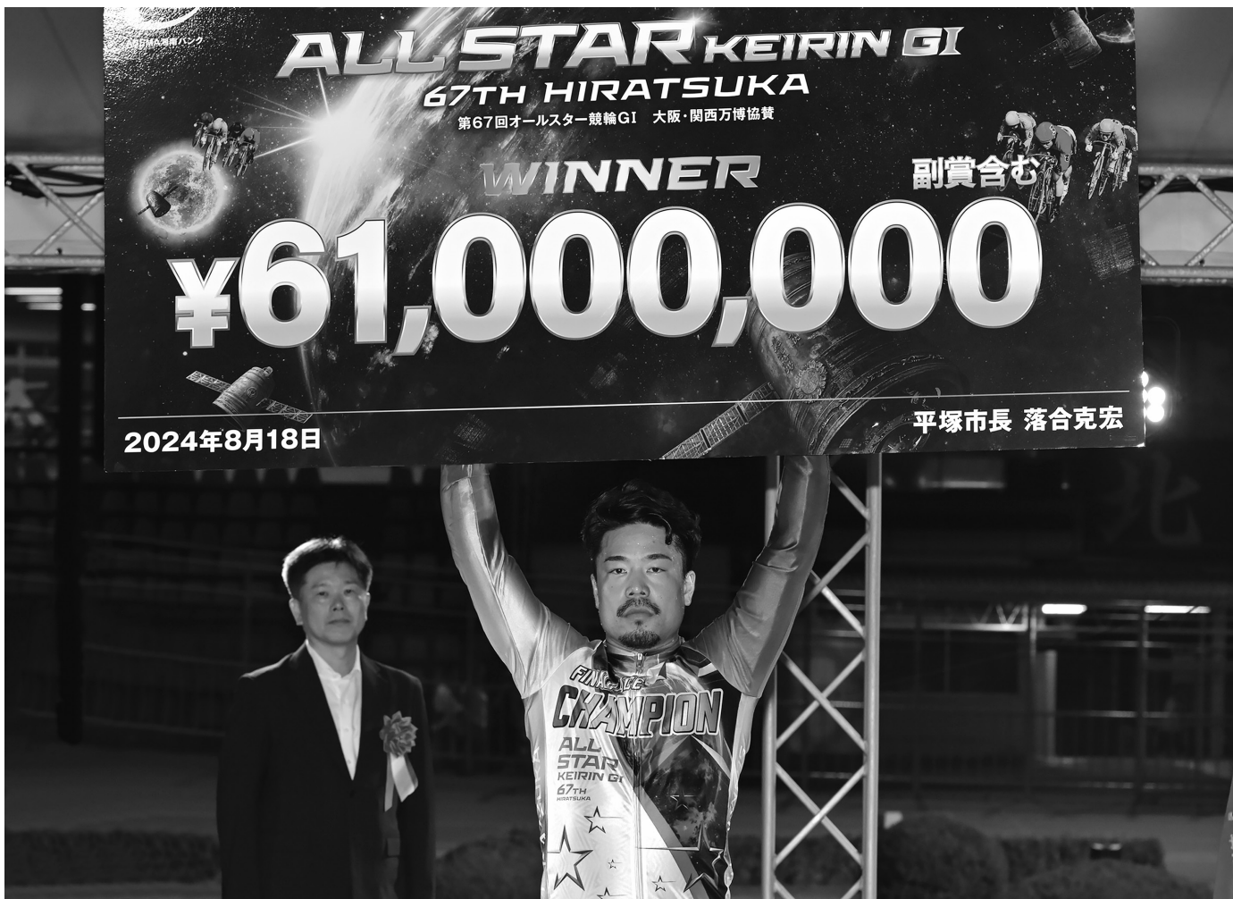
第67回オールスター競輪優勝 古性優作選手(大阪)